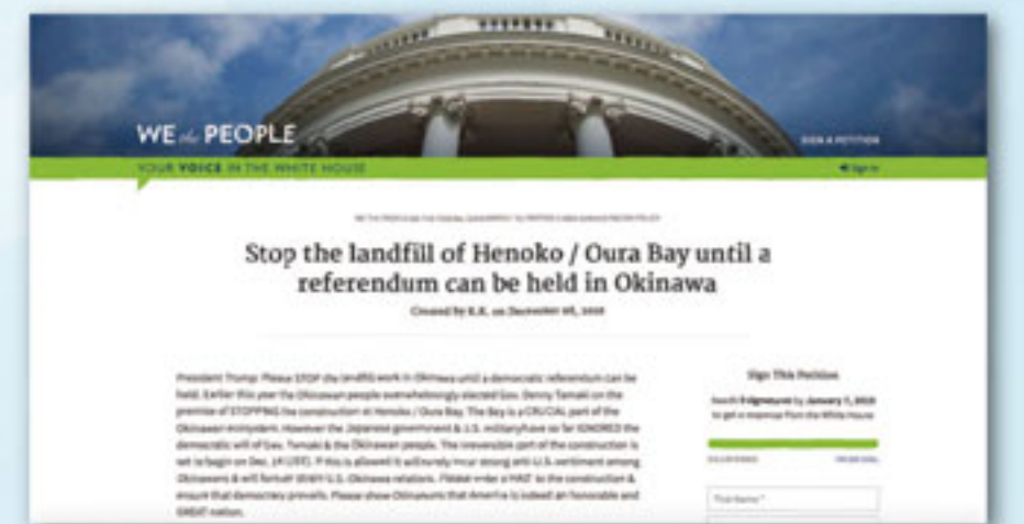
請願サイト「We The People」 クイーンオブライアンメイさんやタレントの ローラさんらも署名しました