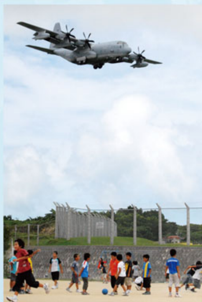
米軍機の部品が落下した 普天間第二小学校

普天間基地は、戦後、住民が収容所に収容されている間に、米軍が住民の土地と財産を許可なく奪ってつくられました。住宅地や学校が密集し、世界一危険だから…老朽化したか