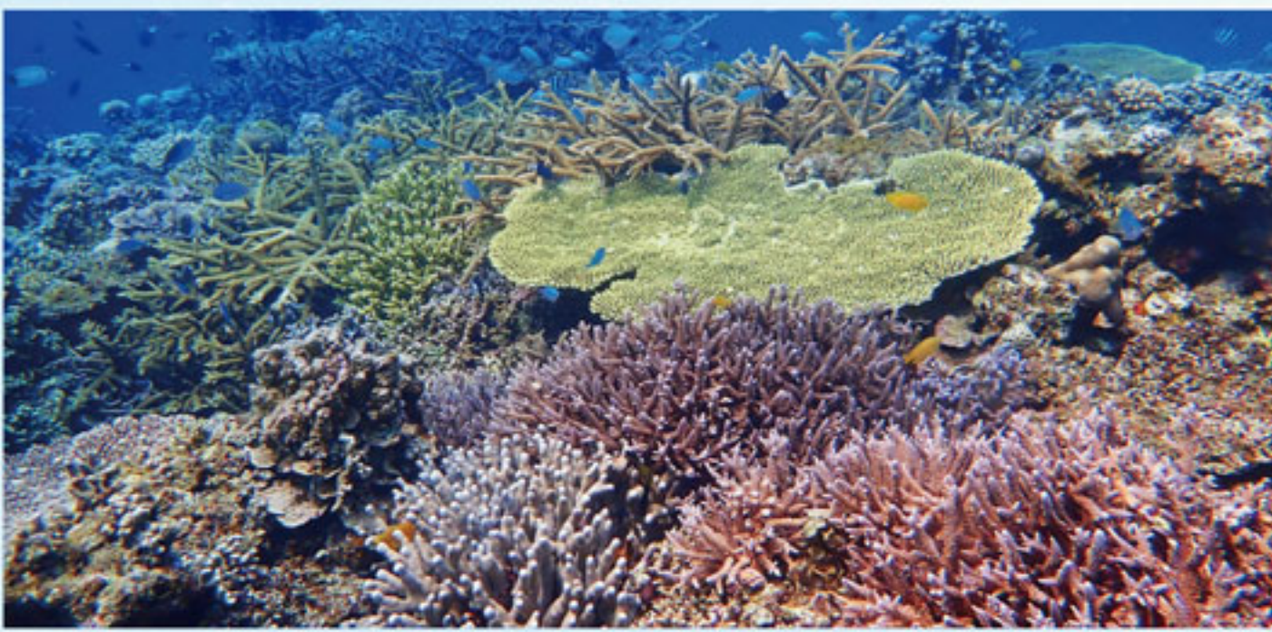
豊かな自然あふれる美ら海辺野古・大浦湾

辺野古新基地は、付近の住宅地・学校（学生・児童・生徒数756人）・公共施設のほとんどが米軍基準でも高さ制限に違反していることが情報公開で明らかとなりました。県民の命と安全が脅かされる米軍新基地建設はただちにやめるべきです。